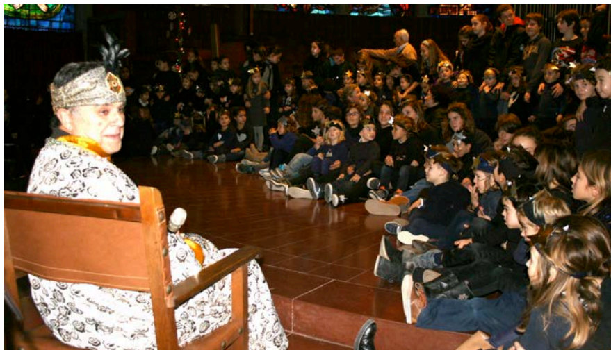
Un mural de lletres realitzades imitant el típic trencadís que utilitzava Gaudí per decorar façanes va ser una de les obres dels estudiants de 4t d'ESO.

Després d'escoltar el concert dels al·lots, el patge reial se n'anà cap a Orient carregat de cartes