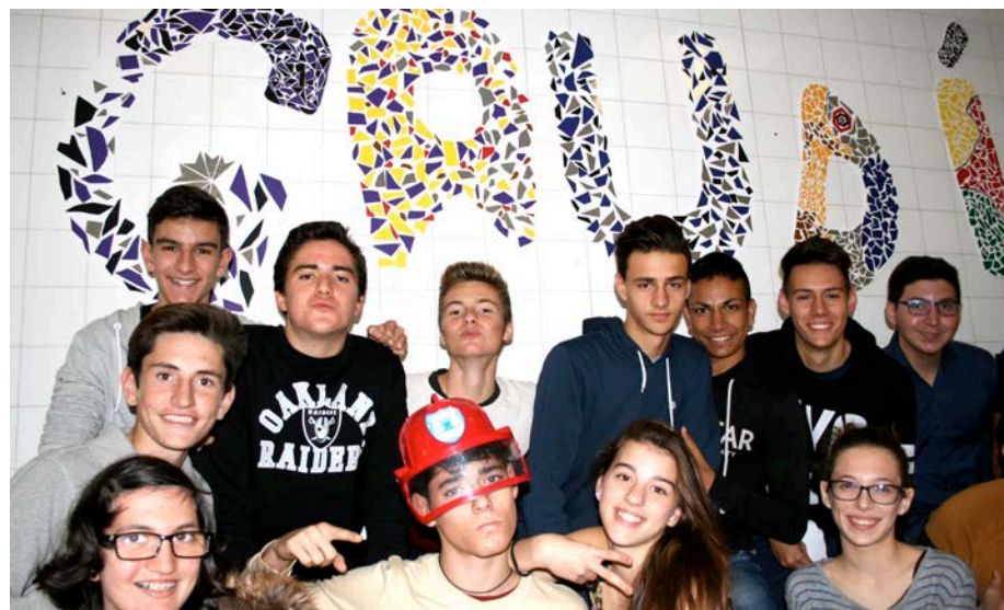
Un mural de lletres realitzades imitant el típic trencadís que utilitzava Gaudí per decorar façanes va ser una de les obres dels estudiants de 4t d'ESO.

La Porciúncula realitza una tasca social, això són projectes relacionats amb un tema en què hi prenen part totes les assignatures