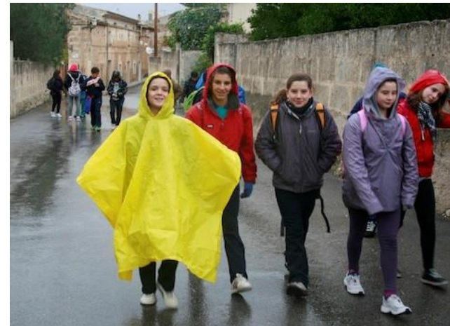
Al seu pas per Petra, i a causa de l'embalum dels impermeables que portaven, alguns habitants del poble confongueren els estudiants de 1r d'ESO amb homos de bulto.

Les ventades i ruixats no impediren que els estudiants d'ESO visitassin Bonany, la vall de Sóller i el camí Vell de Lluc